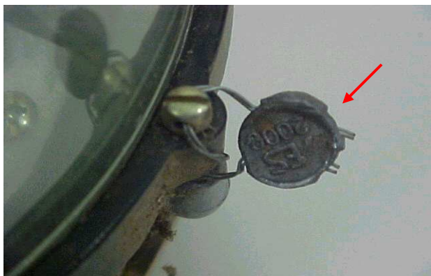
Lacre do medidor falsificado