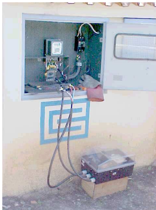
CEDEAR – Aplicação na unidade consumidora.