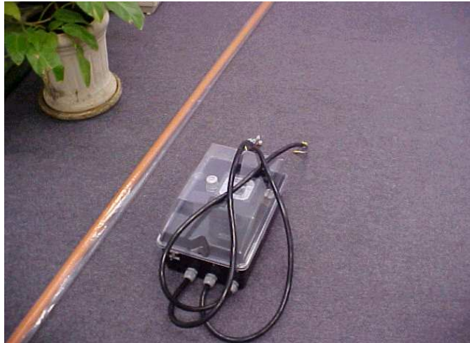
CEDEAR – Protótipo desenvolvido para os primeiros testes de campo.