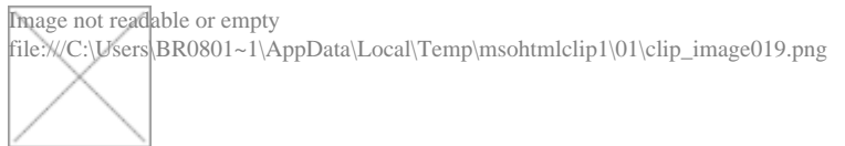
Figura 2. 16 – Tela de informação dos dados de campo

Este resultado final torna possível a localização de defeitos podendo então direcionar as turmas de manutenção do sistema elétrico para o local geograficamente correto com antecipação da localização do defeito. Desta forma, evitam-se procedimentos desnecessários tais como: tentativas de manobras, tentativas de religamentos, resultando em uma maior qualidade no fornecimento de energia e melhorando a segurança no trabalho, sendo possível ainda, a localização do defeito tanto em regime transitório como em regime de falta permanente.