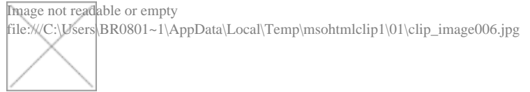
Figura 2.14 – Unifilar de um alimentador com equipamentos de proteção

A Figura 2.14 mostra um diagrama unifilar de um alimentador com a inserção de um religador de linha e chave fusível, o qual foi inserido no diagrama após configuração da proteção, conforme foi comentado na figura anterior.