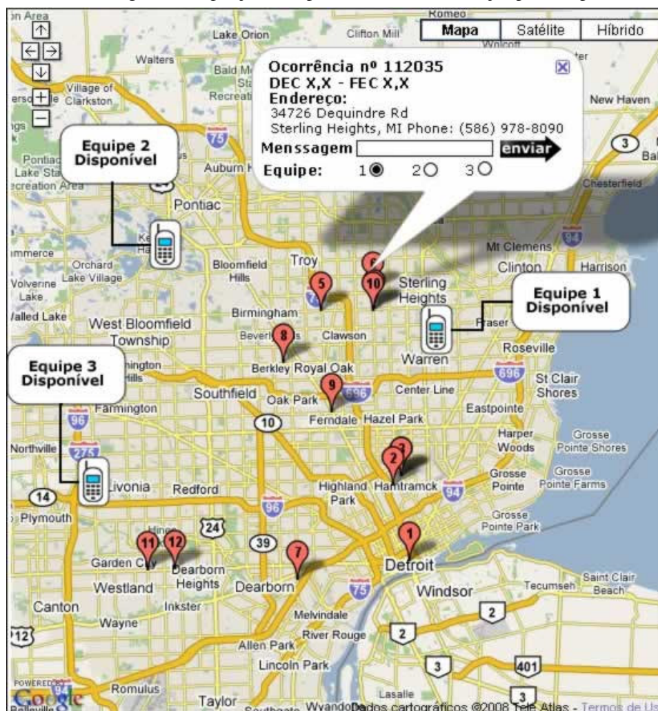
Figura 3: Despacho de ocorrências pela internet

A solução do aplicativo proposto apresenta a imagem de um mapa renderizado pelo navegador baseado em coordenadas geográficas numa aplicação web , interativa que identifica a posição das equipes, localização dos eventos e indicadores do conjunto elétrico afetado, além de possibilitar envio e recebimento de mensagens SMS por janela específica no site de serviços provido pelo mashup .