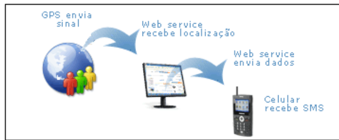
Figura 1: Transmissão de dados e localização por celular

Não existem no mercado aplicações para gerenciamento de equipes que utilizem serviços da rede mundial juntamente com dispositivos móveis, integrados com sistemas da rede corporativa. Devido a esta necessidade de aplicativos, que possibilitem o gerenciamento com a mínima interação humana no processo de alocação de equipes, é que se propõe esse projeto, com objetivo de suprir essa demanda do mercado.