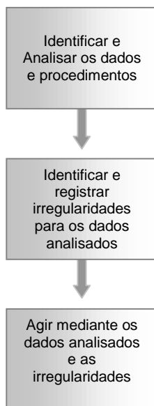
FIGURA 2 – Atividades do Monitoramento

De forma geral as análises do Monitoramento seguem os seguintes passos: