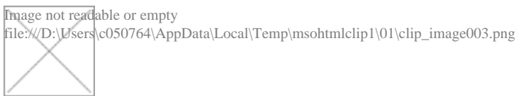
Gráfico 2 – Acompanhamento da temperatura do experimento de compostagem na Baia 2.

Na Baia 3, com 50% de resíduos de óleo mineral e serragem mais 50% de resíduos putrescíveis e húmus, a temperatura inicial medida tem seu valor apurado em 30°C, a maior temperatura apontada em todas as quatro (4) baias. Na primeira semana nota-se uma queda abrupta da temperatura, vindo-se a elevar nos primeiros quinze (15) dias. Com o passar do tempo há o declínio para 22°C ao final do experimento.