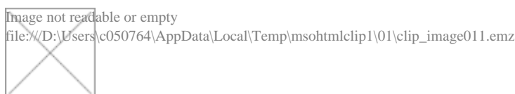
Gráfico 6 – Acompanhamento do percentual de degradação do óleo mineral e óleo vegetal presentes nas amostras das baias: B1, B2, B3 e do óleo mineral da baia B4.

Ainda de acordo com o Gráfico 6, observa-se que há um declínio muito acentuado no percentual de óleo nas baias (B) onde houve a introdução do húmus e do material semi compostado. Destaque é dado à temperatura mais amena durante todo o processo de compostagem na baia quatro (B4) onde não houve a introdução do húmus e nem do material semi compostado. Isso demonstra uma ausência efetiva em maior número de microorganismos na massa do composto e também uma lenta decomposição do óleo, o que se confirma através das análises químicas realizadas nos resíduos com óleo e demonstradas no gráfico comparativo.