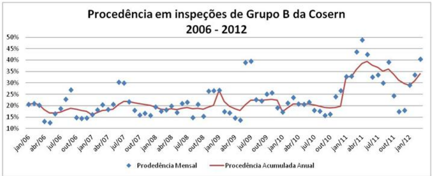
Gráfico 2 - Evolução das procedências mensal e acumulada nas inspeções de Grupo B da Cosern

pré-visitador reconhece defeitos de medição com maior precisão do que o leiturista e para estes processos, a rapidez na identificação é primordial.