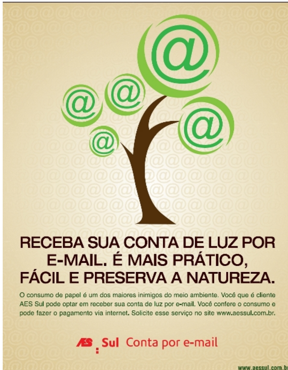
Figura 1 – Verso da conta de março de 2009

A análise do piloto foi satisfatória e em setembro de 2008 foi lançado o serviço Conta por E-mail para os clientes através de informativo no site www.aessul.com.br . A divulgação em grande escala ocorreu em março de 2009, por meio do verso da conta (Figura 1) e de releases na imprensa local.