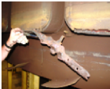
FIGURA 1 – Fusão do material do enrolamento de amortecimento.

Na Figura 1, pode-se observar o material fundido em parte do enrolamento de amortecimento dos pólos.