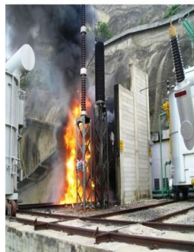
FIGURA 3 – Incêndio no transformador elevador de Paulo Afonso III.

Por outro lado, pode-se observar na Figura 3, que o transformador elevador foi submetido a um fogo fora de controle, portanto um incêndio, exatamente como definido na NBR-13.860.