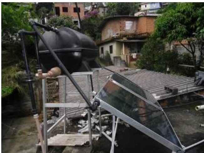
Figura 15. Instalação da 2ª experiência de campo, concluída, com reservatório e placas sobre suporte de alumínio.