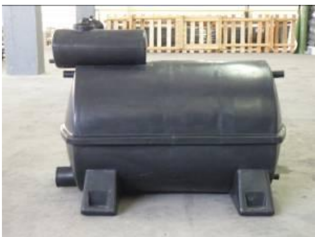
Figura 4. Vista lateral do reservatório roto-moldado, sem pintura externa.

A seguir realizou-se experiência piloto com fabricação e a instalação de cinco protótipos iguais à melhor solução escolhida para avaliar na prática diária o conforto térmico proporcionado pelo sistema e verificar a redução do consumo de eletricidade com o uso do sistema de aquecimento, bem como o comportamento dos componentes. Cada um dos 5 sistemas foi instalado em uma casa do tipo baixa renda.