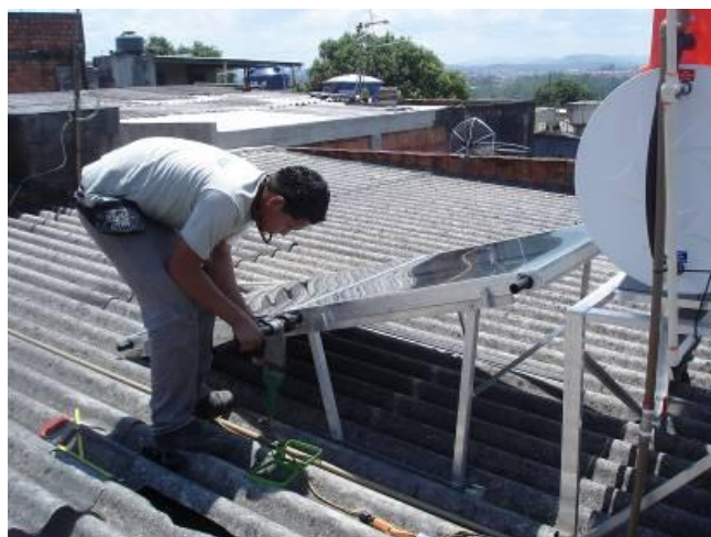
Figura 13. Obras durante a instalação do sistema solar de uma residência com cobertura de telha tipo “brasilit” que recobria a laje.

Após o re-projeto foram fabricadas 10 unidades correspondentes aos novos tipos de reservatórios projeto, e implementadas suas instalações em casas numa segunda experiência piloto no campo, para proceder a medições de consumo de energia em períodos de uso dos chuveiros para efeito comparativo e extrair as conclusões finais.