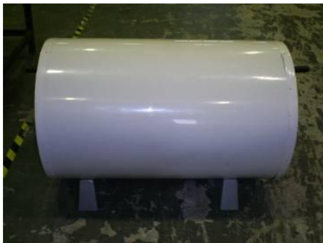
Figura 12. Reservatório pronto, após receber uma camada de espuma plástica sobre a “bolsa” térmica da Figura 8, e uma folha fina de acabamento de plástico em material PET na cor branca.

Mesmo tendo-se informado os moradores no início da experiência prática de campo sobre o que foi instalado em suas residências e os objetivos da experiência, e apesar de instruídos no uso do misturador que foi instalado junto ao chuveiro existente em cada moradia, constatou-se que em algumas casas foi abaixo do esperado a redução nas contas de energia, atribuindo-se ao uso incorreto da água quente por parte de algumas pessoas. Com práticas como desprezar o misturador e usar só o chuveiro para aquecer a água, devido à demora entre acionar o misturador e a chegada da água quente; ou fazer uso de outro chuveiro “que era muito mais rápido” do que aquele associado ao reservatório do sistema solar.