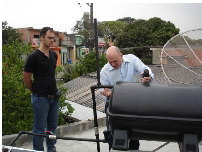
Figura 8. Verificações procedidas em 05/10/10. Em primeiro plano o reservatório de água quente instalado, na cor original de fabricação sem pintura.

Os 5 protótipos ficaram instalados por três meses, período da 1ª experiência piloto de campo. Todas as instalações foram feitas com uso de suportes fabricados em alumínio, e essa providencia tornou fácil a fixação sob as diversas situações de telhados e lajes e possibilitou que todas as placas coletoras ficassem posicionadas de frente para o Norte.