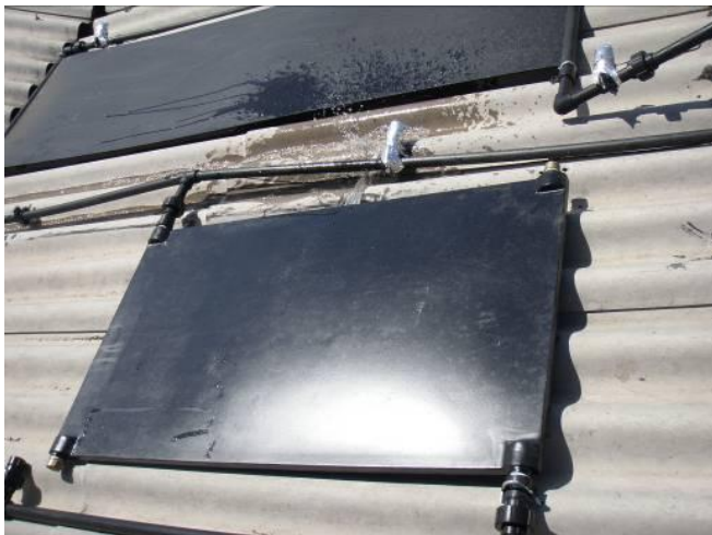
Figura 1. Placa de Fibra de Vidro durante os testes de desempenho simul-tâneos nas 3 alternativas de coletores. Ocorreu rachadura e vazamento.

O acompanhamento dessa primeira experiência, bem como nas medições de campo posteriores, foi feito com registro diário do desempenho térmico de cada sistema pelo marcador de temperatura Microsol II Plus Versão 3 alimentando um conversor de dados interface Full Gauge - Conv 256, cujas saídas eram em gráficos como os abaixo.