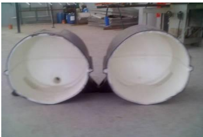
Figura 3. Reservatório de plástico, cortado ao meio durante ensaios.