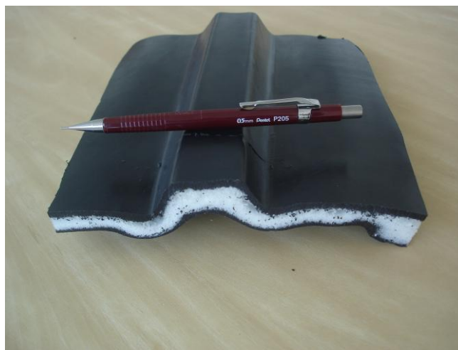
Figura 9. Nova parede em três camadas de material plástico do novo reservatório, para prover maior isolamento térmico e aumento na eficiência em conservar o calor da água de seu interior.

Decidiu-se nesse momento criar duas novas variações do reservatório de água quente, o primeiro tipo com mesmo conceito roto-moldado da 1ª experiência de campo, porém com paredes novas constituídas agora de 3 camadas de material plástico, ao invés de duas camadas do projeto original; o segundo tipo, parte do original (uma “bolsa” de material plástico) e recebeu uma camada externa de espuma plástica isolante térmica e uma folha de acabamento de plástico fino e flexível de material PET.