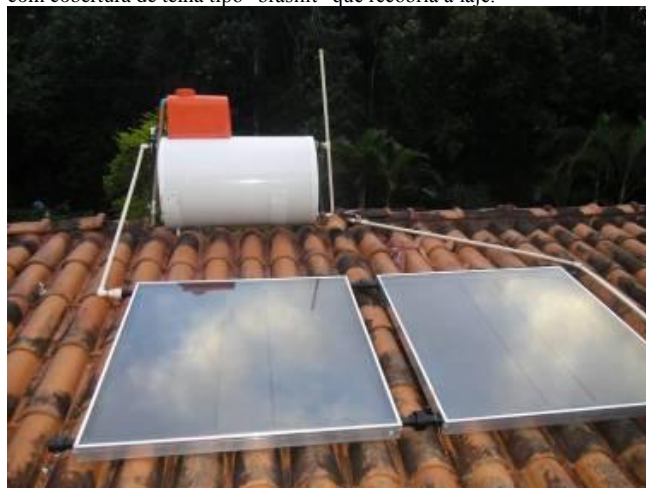
Figura 14. Instalação de sistema com reservatório do tipo 3. A peça de cor laranja apenas cobre uma bóia que tem a finalidade de quebrar a pressão da água que aporta ao sistema.