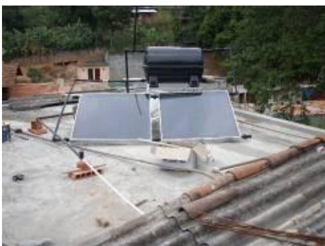
Figura 5. Instalação de um protótipo sobre a laje da casa.

A seguir realizou-se experiência piloto com fabricação e a instalação de cinco protótipos iguais à melhor solução escolhida para avaliar na prática diária o conforto térmico proporcionado pelo sistema e verificar a redução do consumo de eletricidade com o uso do sistema de aquecimento, bem como o comportamento dos componentes. Cada um dos 5 sistemas foi instalado em uma casa do tipo baixa renda.