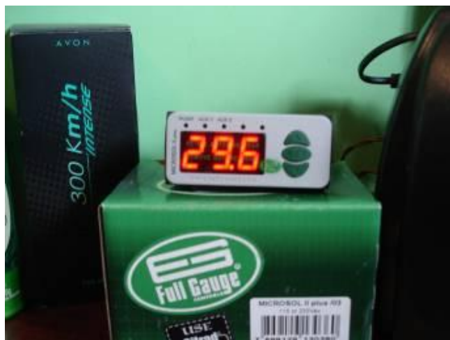
Figura 6. Leitura do sensor da temperatura da água na saída do reservatório para o chuveiro, em verificação logo após a instalação.