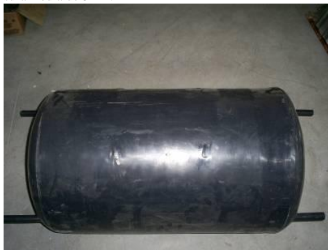
Figura 10. Parte interna do reservatório roto-moldado, igual ao projeto original. Esse componente ainda será revestido de mais material isolante.

A primeira camada (externa) de plástico tem uma espessura média de 3 mm. A segunda camada de espuma branca do mesmo plástico, tem uma espessura média de 22 mm. A terceira camada interna de polietileno tem também uma espessura média de 3mm.