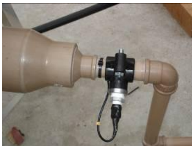
Figura 7. Um dos sensores de monitoramento da temperatura da água.