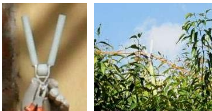
FIG. 7 – DISPOSITIVO AUXILIAR EM “V”