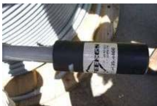
FIG. 4 – MUFLA TERMINAL PARA CABO PROTEGIDO DE 185 mm 2