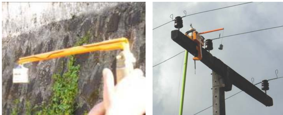
FIG. 2 – LANÇADOR DE CORDA-GUIA