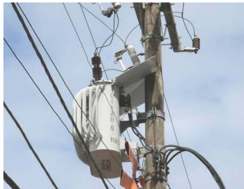
FIG. 9 – BARREIRA ERGONOMÉTRICA DESENVOLVIDA