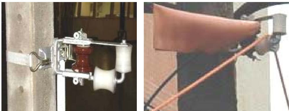
FIG. 6 – CARRETIHAS DE BAIXA TENSÃO DESENVOLVIDAS