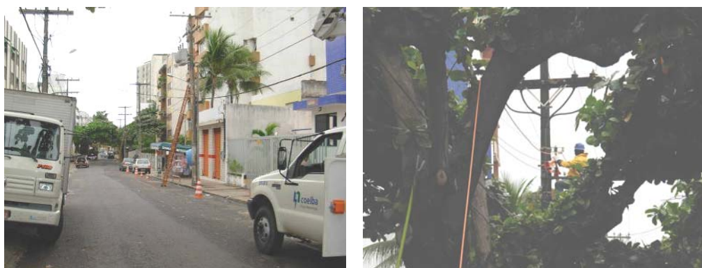
FIG. 11 – REDE DE BAIXA TENSÃO EM MANUTENÇÃO

A validação da metodologia de substituição de condutores da rede de baixa tensão foi realizada em uma área residencial da orla de Salvador, sem interferir significativamente na rotina dos moradores e comerciantes da região. A única intervenção realizada, como medida de precaução, foi solicitar aos moradores que retirassem seus veículos do lado da rua onde o serviço foi executado.