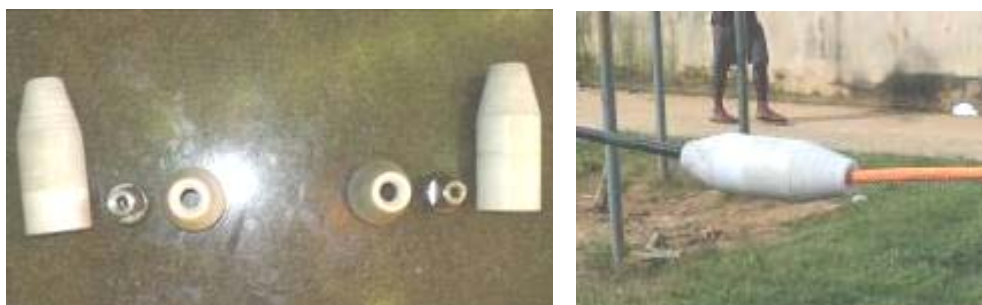
FIG. 3 – ACOPLADORES CABO-CORDA DE 35 mm 2 E 70 mm 2