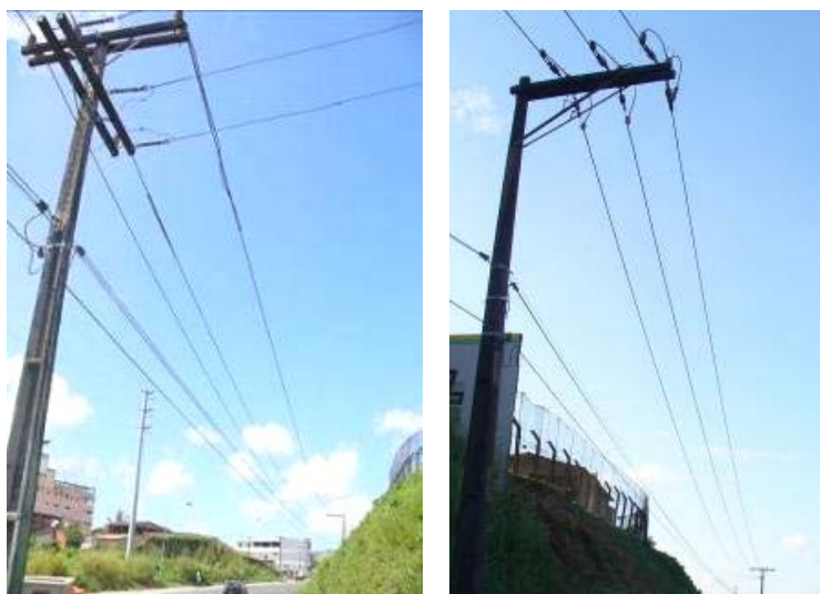
FIG. 5 – REDE DE MÉDIA TENSÃO ANTES E APÓS A MANUTENÇÃO

Para validação da metodologia desenvolvida, foi selecionado um trecho da rede de distribuição da COELBA, na região metropolitana de Salvador, em uma rodovia com grande circulação de veículos e pedestres. O trecho escolhido possuía cabos de alumínio de bitola 366, fragilizados pela ação de cerol de barbantes de pipas, bem como com diversas emendas instaladas. O trabalho foi realizado sobre dois vãos de 100 m e 64 m, conforme ilustrado na Figura 5. O novo cabo lançado era de tipo protegido, com bitola de 185 mm 2 .