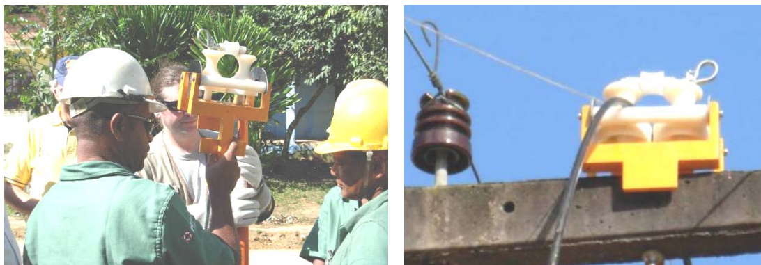
FIG. 1 – CARRETLHAS DE MÉDIA TENSÃO DESENVOLVIDAS