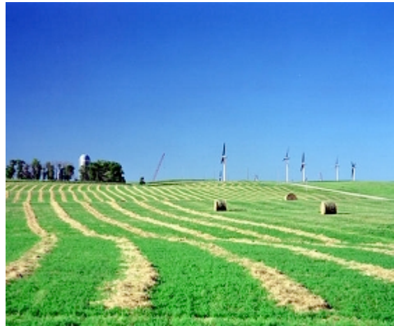
FIGURA 4 – Prática de atividades agrícolas em parques eólicos.

Os 4.300 aerogeradores instalados na Dinamarca pelo fim de 1997 produzem a mesma quantidade de eletricidade do total consumido em 1952. Acima de 7% do consumo nacional de eletricidade na Dinamarca é agora abastecida por energia eólica e o país está caminhando para atingir a meta de 10% no ano 2005. Esta meta poderia ser atingida com a instalação de 1000 turbinas do atual estado da arte, devido às melhorias tecnológicas e aumento da capacidade dos aerogeradores. A área de terra requerida seria aproximadamente 100 km 2 , onde apenas 1% seria utilizado para fundações das turbinas (EWEA, 2000).