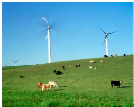
FIGURA 1 – Atividades em parques eólicos.

A energia eólica por sua vez, não utiliza a água como elemento motriz, nem como fluido refrigerante e não produz resíduo radioativo ou gasoso. Pode-se ainda utilizar a área do parque eólico como pastagens e outras atividades agrícolas.