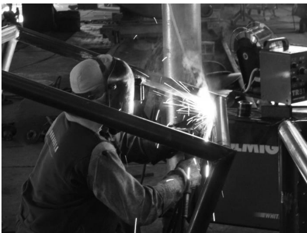
Figura 4. Construção das estruturas metálicas para servirem como recifes artificiais em Suape.

Na etapa seguinte, foi contratada a empresa NORAÇO para a construção do recife artificial que foi composta por dezoito blocos de aço vazado, com dimensão de 1m 2 . Esse processo de construção e entrega das estruturas ocorreram entre os meses de agosto de 2010 e fevereiro de 2011 (Figura 4).