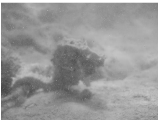
Figura 9. Cavalo marinho registrado no interior do canal de captação de água da TERMOPE.

Depois de cinco anos de monitoramento da região de influência da Usina termelétrica, é possível observar o aumento da população de ouriços do mar, da espécie Echinometra lucunter (um importante elemento bioerosivo para o litoral pernambucano segundo [18] e presença de representantes de escleractínios como Siderastrea stellata , Favia grávida e Mussismilia SP (Figuras 9, 10 e 11).