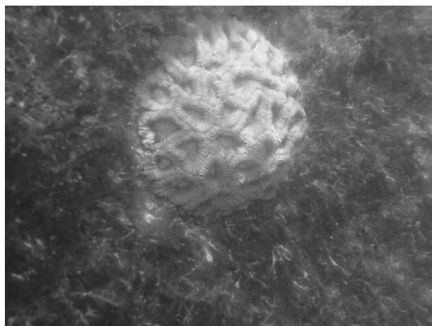
Figura 11. Coral do gênero Mussismilia observado no canal de captação de água da TERMOPE.

O monitoramento ambiental através do estudo das comunidades bentônicas apresenta, pelo menos, três aspectos positivos: 1) os organismos bentônicos são relativamente sedentários e têm uma certa longevidade; 2) ocupam uma importante posição trófica intermediária, são produtores secundários; 3) respondem diferentemente às variações das condições ambientais. De acordo com o levantamento realizado no canal de captação de água da TERMOPE, foram identificadas diversas espécies que podem ser consideradas como bioindicadoras da qualidade ambiental. Essas espécies de macroinvertebrados bentônicos apresentam certa tolerância frente às adversidades ambientais, sendo classificadas em três grupos principais (existem exceções dentro de cada grupo): organismos sensíveis ou intolerantes, organismos tolerantes e organismos resistentes [19]. É importante lembrar que os maiores distúrbios relacionados ao canal de captação de água da TERMOPE são oriundos do Rio Ipojuca, através do despejo de águas estuarinas e forte sedimentação ao longo de alguns meses do ano. Os processos de captação de água não têm apresentado influência direta sobre os componentes da fauna. Dentre os organismos mais