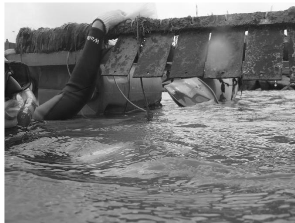
Figura 2. Placas de testes de substrato sendo testadas no canal de captação de água da TERMOPE.

Esta pesquisa foi desenvolvida entre agosto de 2009 a julho de 2011. No primeiro ano de estudo foram definidos os modelos e a natureza do substrato mais adequado para a construção do recife artificial, para a construção de um protótipo para a região. Foram testados processos de recrutamento sobre substrato metálico e de concreto (Figura 2). Esta etapa foi desenvolvida entre os meses de agosto a dezembro de 2009. Ficou definido que o modelo mais adequado seria fabricado em metal, pela facilidade de construção, transporte e instalação do recife.