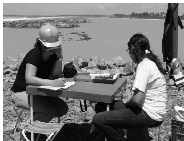
Figura 8. Análises hidrológicas do canal de captação de água da TERMOPE

A etapa de estudos sobre recrutamento de larvas e sucessão ecológica já foram concluídas e estuda-se agora a instalação de um modelo adequado de recife artificial que atenda as demandas da área quanto ao processo de povoamento de peixes e análises hidrológicas do canal de captação de água da TERMOPE (Figura 8).