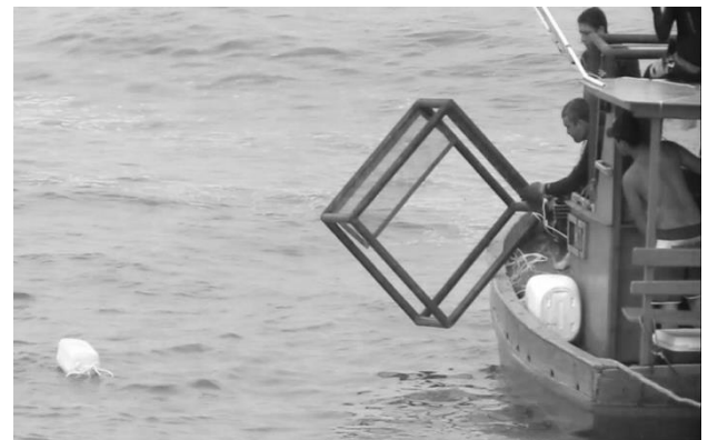
Figura 5 e 6. Operação para instalação do recife artificial em frente ao canal de captação de água da TERMOPE.