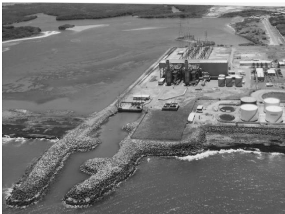
Figura 1. Vista geral da TERMOPE e o seu canal de captação de água em Suape.

Esta pesquisa já avançou em suas etapas preliminares, quando estabeleceu o padrão de recrutamento e sucessão ecológica da comunidade incrustante na região. Essa primeira etapa seguiu indicativos de experiências pretéritas para estudos de recifes, como os estudos desenvolvidos no litoral da Inglaterra no artigo [3], que indicaram uma série de investigações preliminares antes da instalação definitiva de sistemas de recifes artificiais.