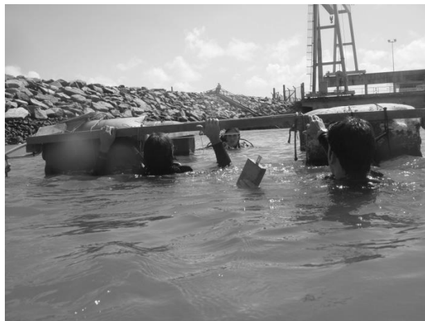
Figura 7. Equipe de pesquisadores monitorando o flutuante com placas de recrutamento de larvas no canal de captação de água

populacional de organismos, comparados a áreas de recifes naturais.