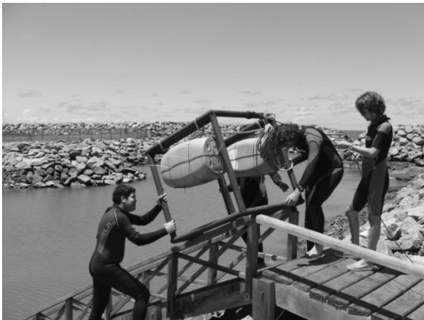
Figura 3. Instalação do protótipo do recife no canal de captação de água da TERMOPE.

Este protótipo foi monitorado por um período de doze meses (abril de 2010 a fevereiro de 2011) e apresentou resultados satisfatórios para o objetivo final do projeto que estabelecia a implantação da estrutura recifal na área de influência da Usina Termelétrica.